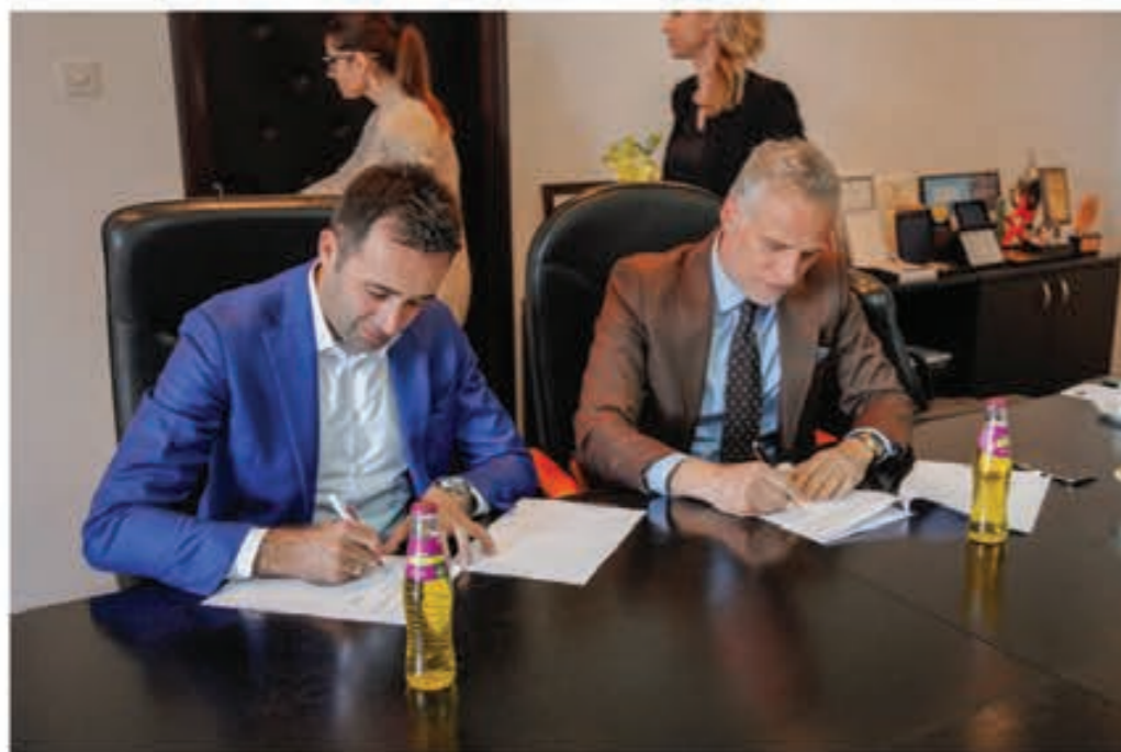
Потпишување на договорот за соработка помеѓу Прилепска пиварница и Универзитетот ФОН

Право на учество во проектот Фабрика на знаење имаат студентите од прва до петта година заради неопходноста од поседување одредени предзнаења за учество во проектот. Проектот е конципиран интердисциплинарно, односно учество во проектот земаат студентите од сите факултети кои се дел од Универзитетот ФОН. Ваквиот концепт ја овозможува комплетната реализација што би можела да ја даде некоја етаблирана компанија, со оглед на разновидноста на едукацијата која ја имаат сите студенти, кои се дел од проектот.